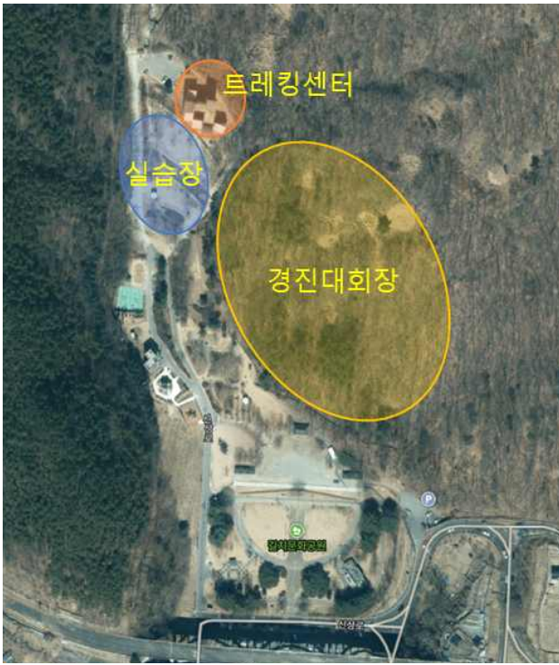
트레킹센터(개회식 및 교육장), 길치문화공원(경진장)